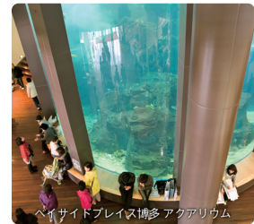
ベイスайдプレイス博多 アクアリウム